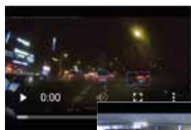
Riconoscimento con scena in movimento.