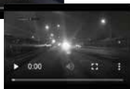
Elevata resistenza ai disturbi (fari automobili).